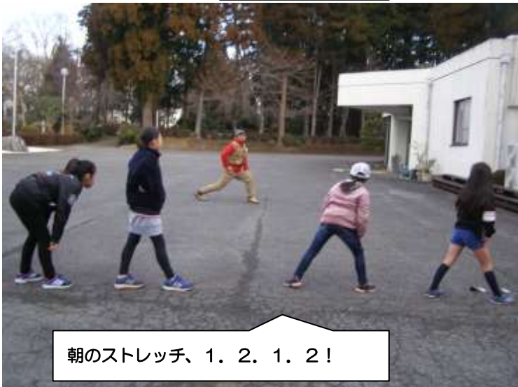
朝のストレッチ、1. 2. 1. 2！