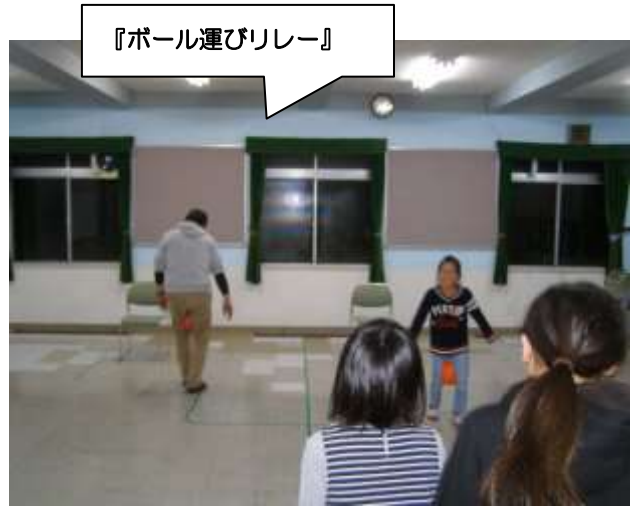
『ボール運びリレー』