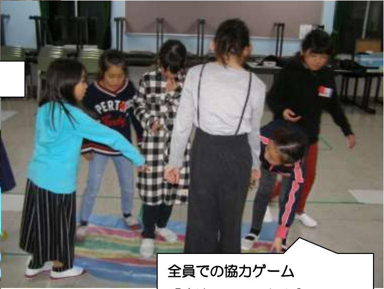
全員での協力ゲーム 『魔法のじゅうたん』