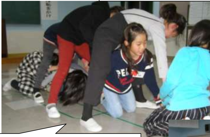
足の下を潜り抜ける『蛇の脱皮』